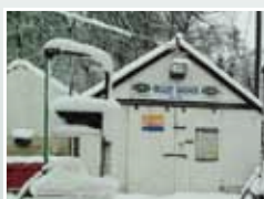
станции тех обслуживания