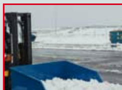
погрузочно – разгрузочные