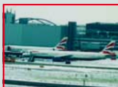
взлетно – посадочные полосы