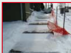
подъемы и спуски